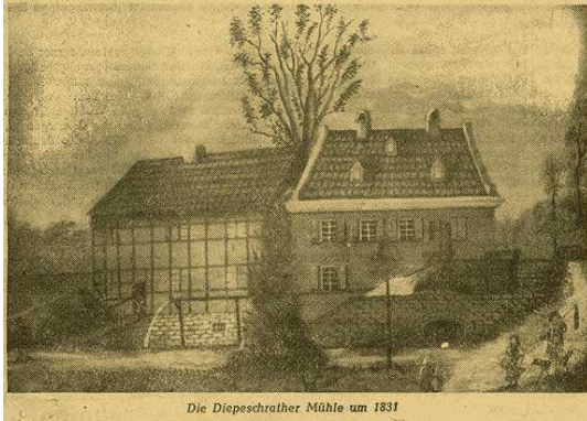
Die Diepeschrather Mühle um 1831