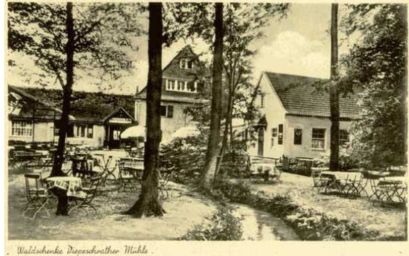
Waldschänke Diepeschrather Mühle